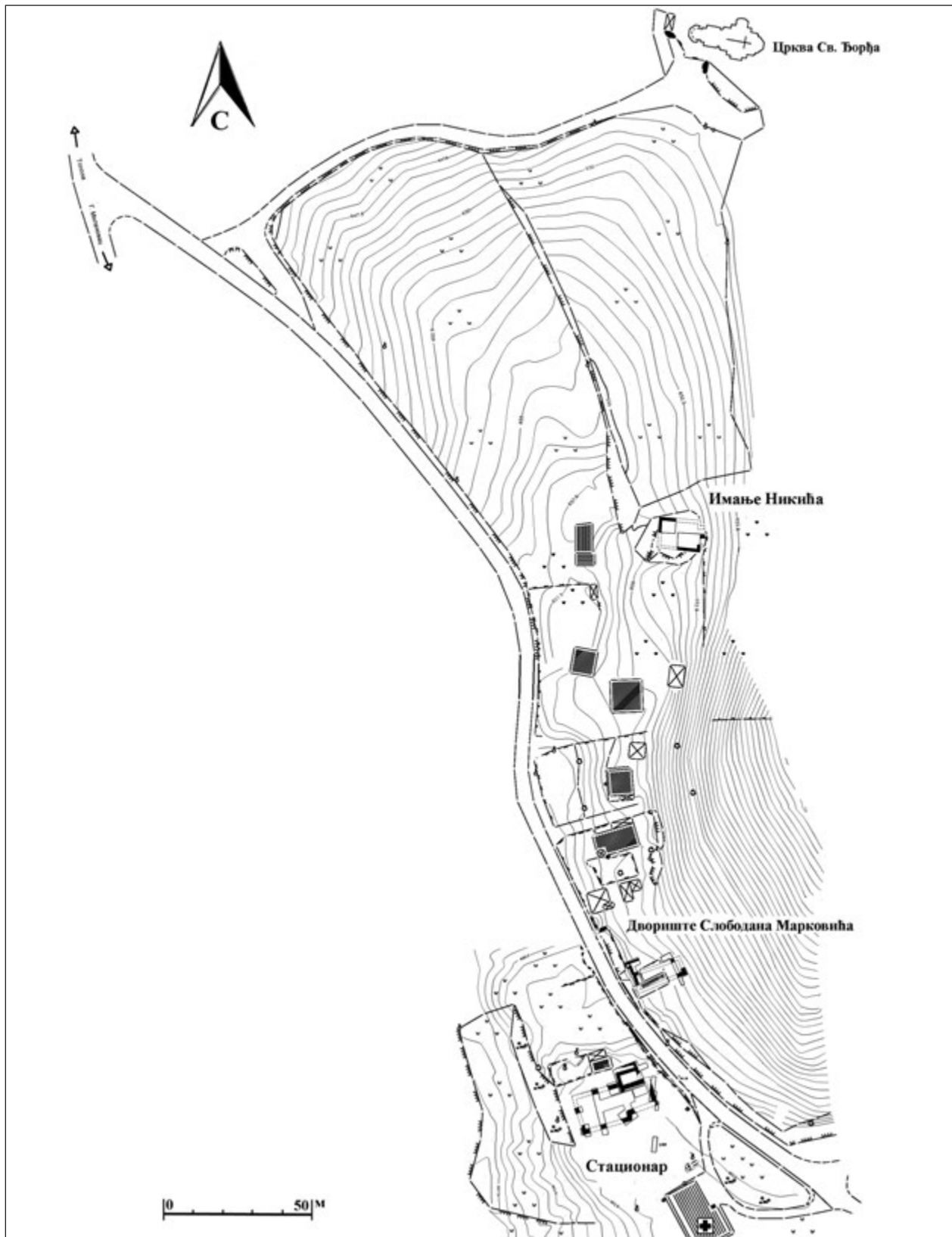
Сл. 2. Рудник – Дрење, ситуациони план