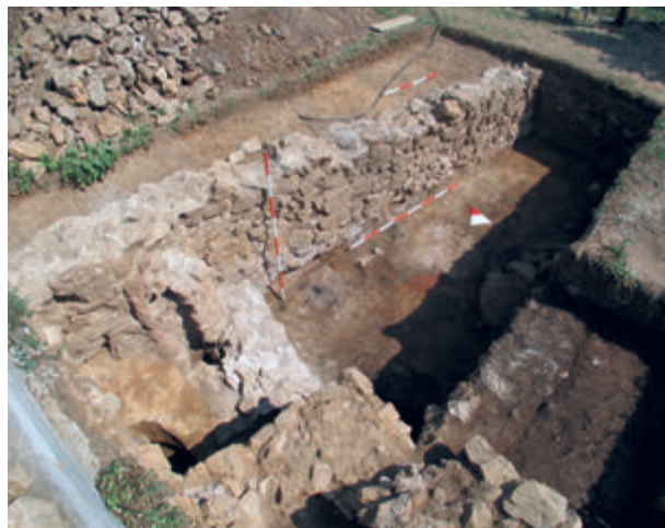
Сл. 4 и 5. Дрење – Двориште С. Марковића, ископ из 2015. године, унутрашњости објекта на нивоу пода и унутрашњости објекта на нивоу здравнице – непосредно пред ископавање северне половине јаме бр. 2

Испод ове грађевине констатовани су трагови раније фазе живота. Већ на почетку истраживања објекта издвојен је старији културни слој испод малтерног пода на источној страни, док су током последње кампање у 2015. години испод пода у северозападном делу грађевине откривене старије јаме (сл. 5).