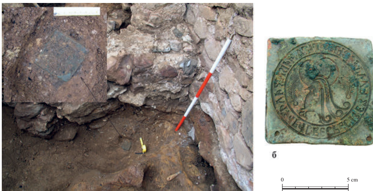
Сл. 6. Северна половина јаме бр. 2: (а) налаз in situ, (б) изглед штипара након проналаска