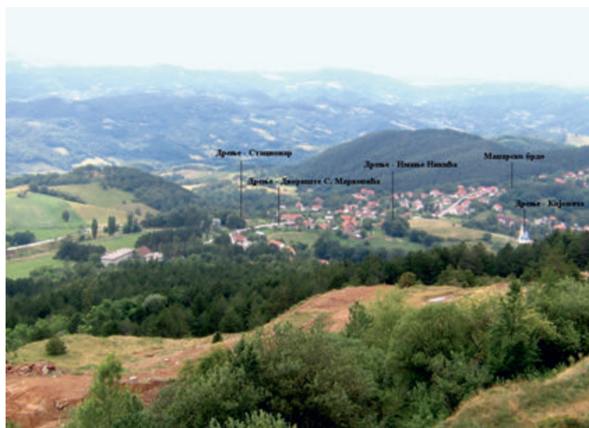
Сл. 1. Рудник, локалитети археолошки ископавани 2009–2015. године (Дрење – Стационар, Дрење – Двориште С. Марковића, Дрење – Иманање Никичића и Маџарско брдо), поглед са југоистока