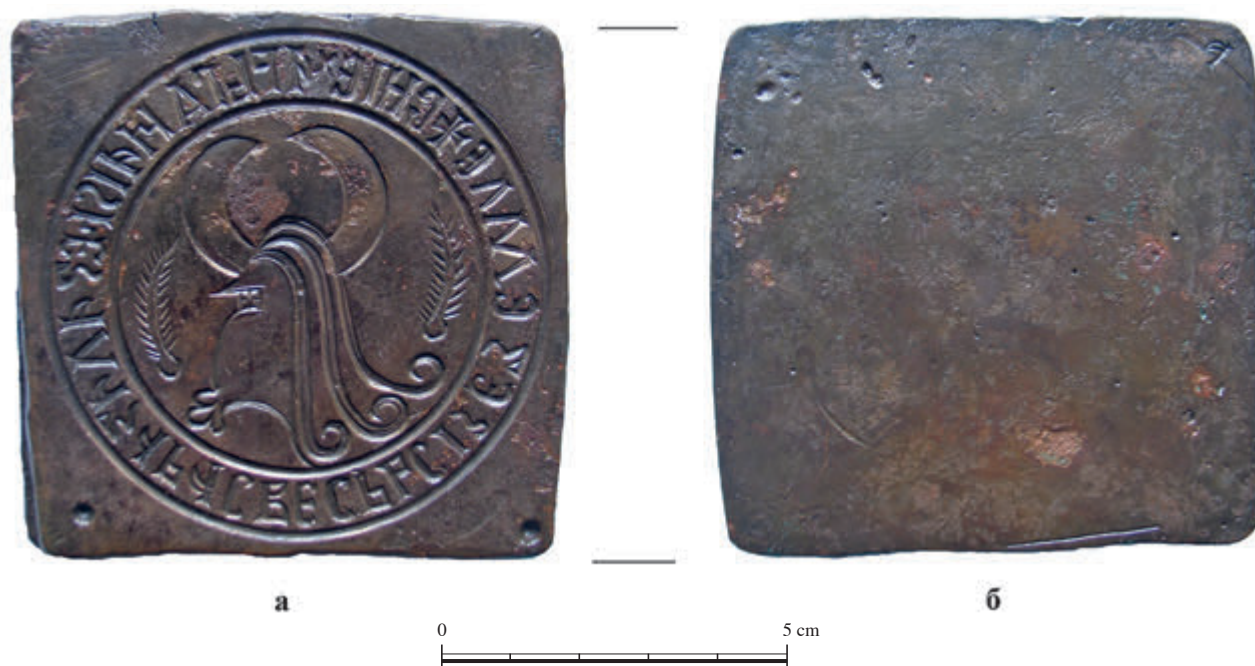
Сл. 7. Типар кнеза Лазара, након конзервативорској шрејмана