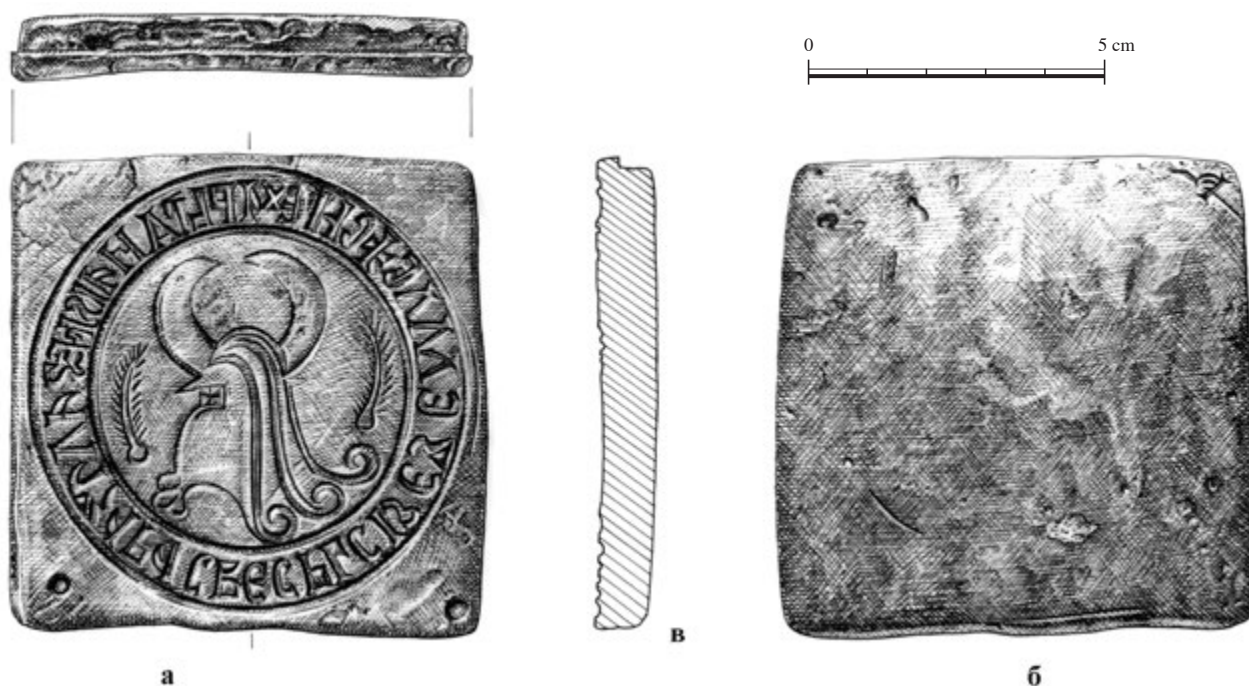
Сл. 8. Типар кнеза Лазара (цртеж: С. Марковић)