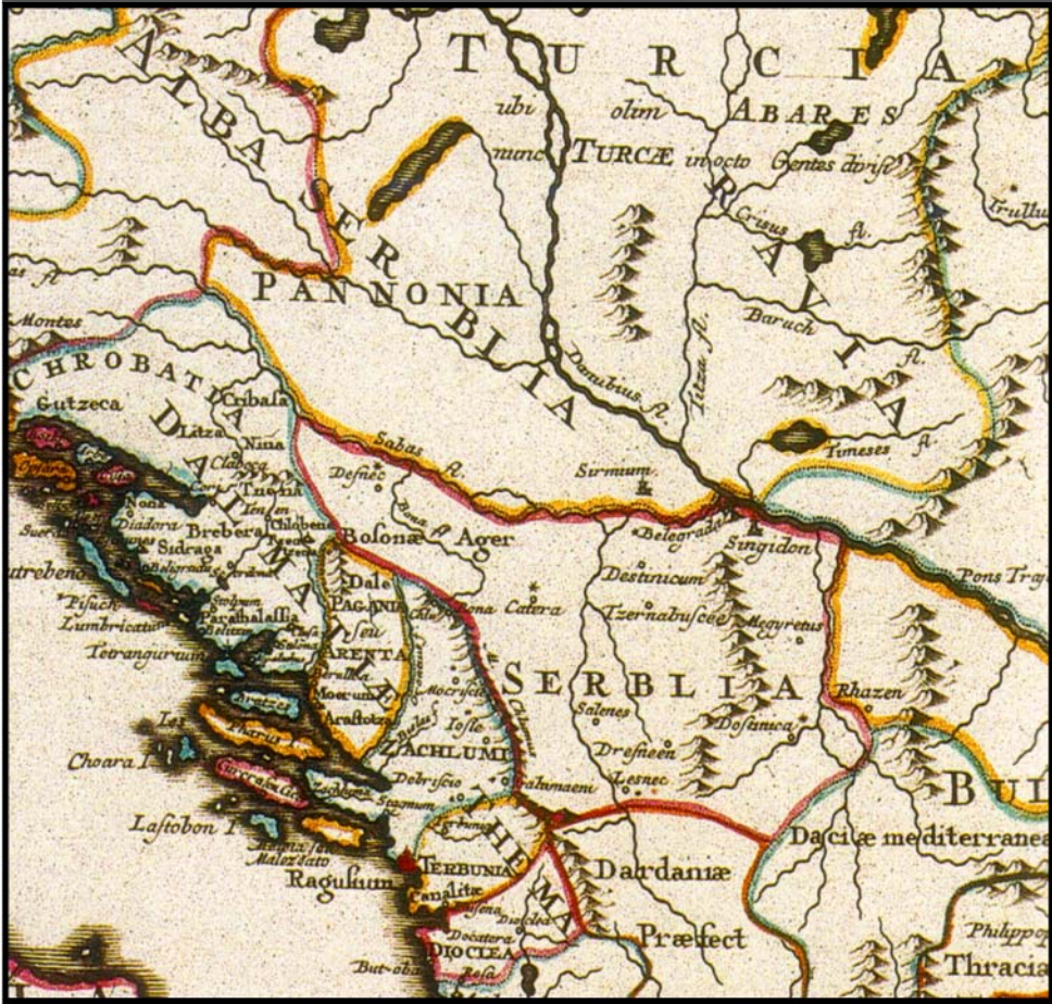
Сл. 2. - Фрагмент карте Гијом де Лиља: Источна империја и суседни региони по Константину Порфирогениту