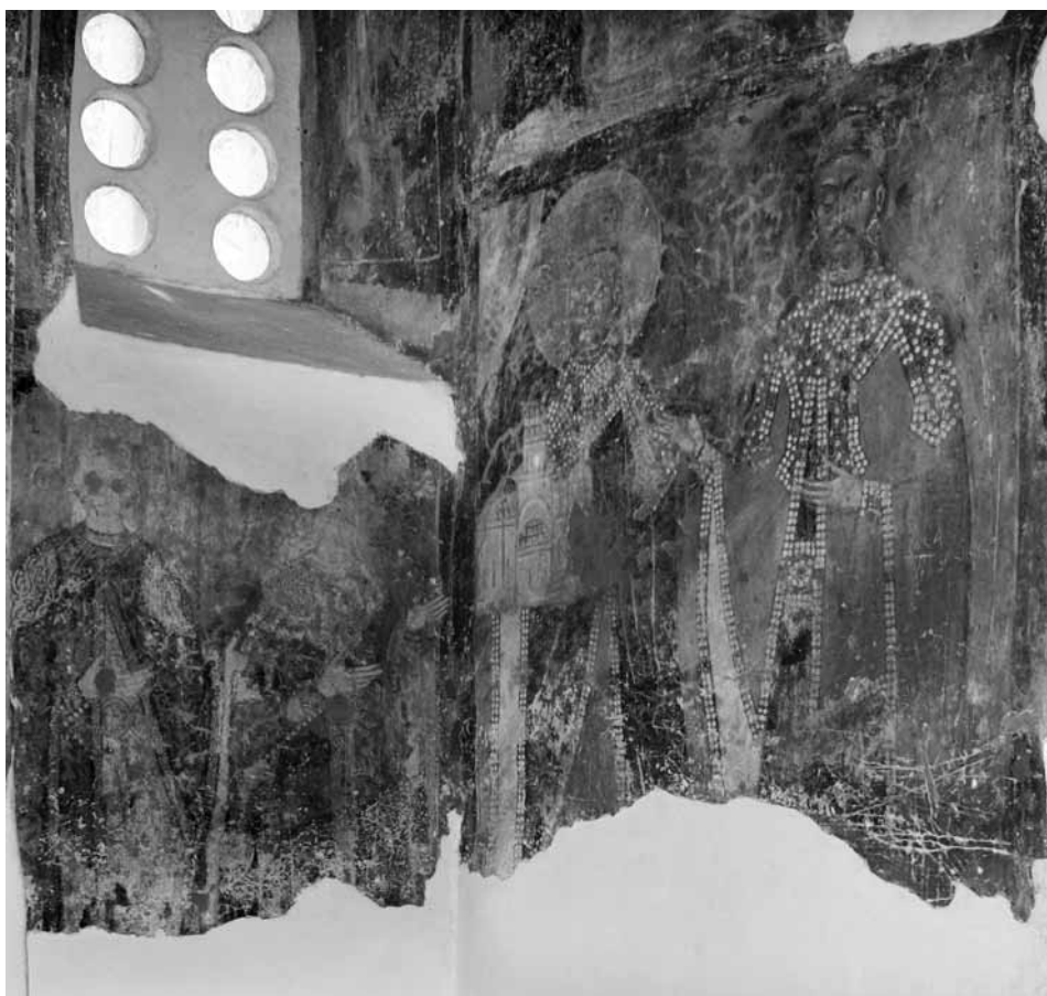
Сл. 4. Рудница, портрети, југозападни угао наоса