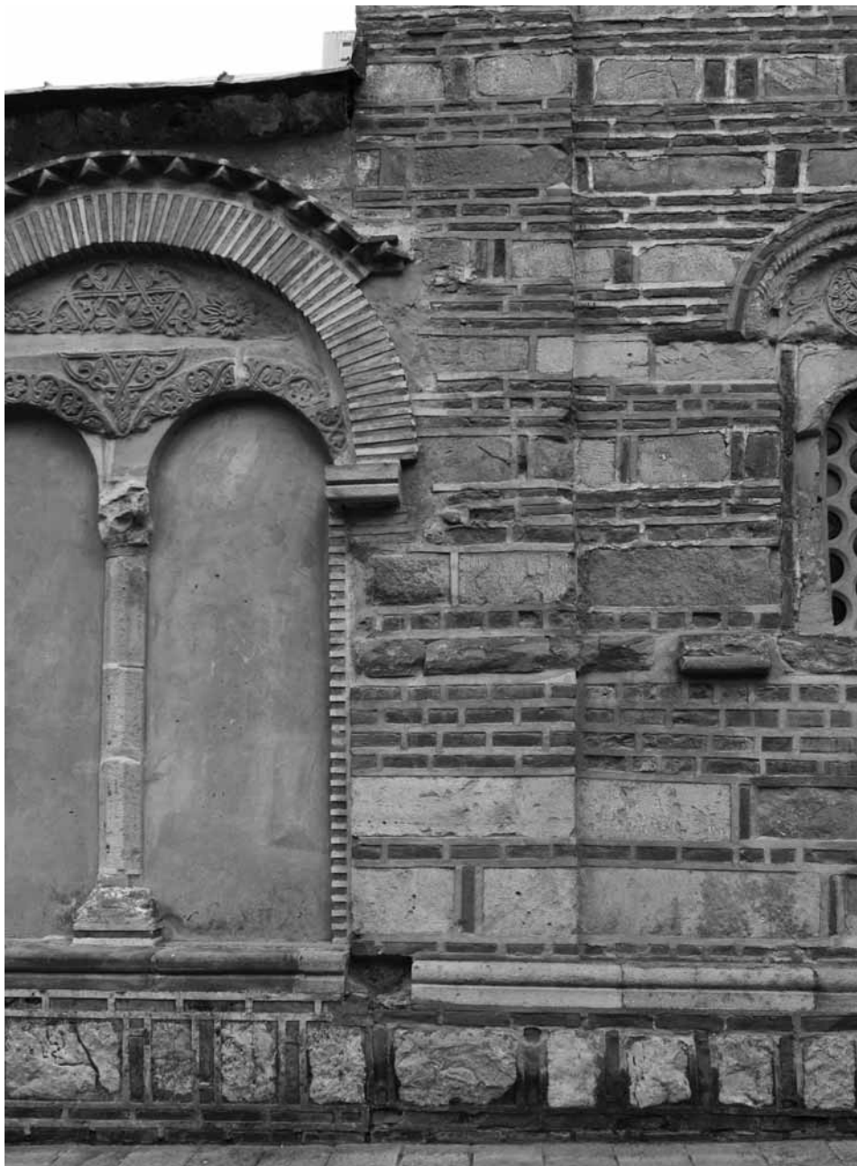
Сл. 2. Раваница, јужна фасада, спој зидова наоса и припрате