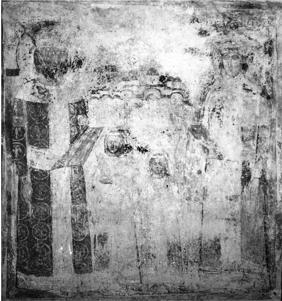
Сл. 1. Раваница, портретска композиција, фотографија Републичког завода за заштиту споменика културе